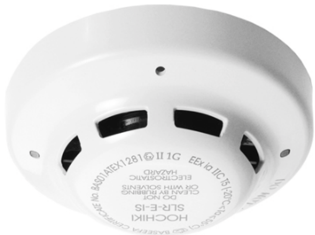
Opticko kouřový hlásič SLR-E-IS