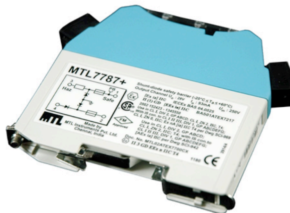
Zenerova bariéra MTL7787+