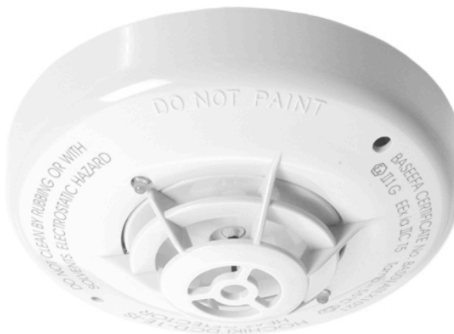
Teplotní hlásič DCD-1E-IS