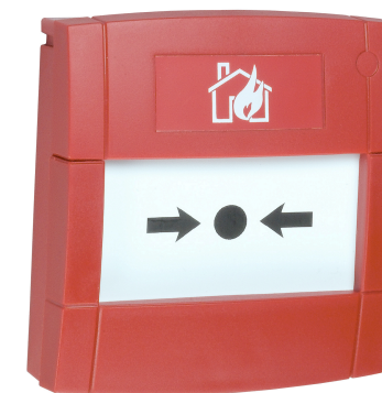
Tlačítkový hlásič vnitřní MCP-3A-IS